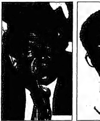
فيصل دراج (اليمين)

عبد الرحمن منيف، وهو من الأديب العربي الكبير، ولد في دمشق عام 1919. كان من أبرز رواد الأدب العربي الحديث، وله أعمال كثيرة في الشعر والرواية والقصص. كان من المهتمين بقضايا الحرية والديمقراطية، وشارك في العديد من الحملات النضالية.